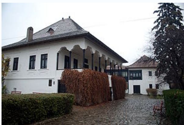
Casa memorială din Vălenii de Munte

Nicolae Iorga a avut un sfârșit tragic, fiind ridicat de la vila sa din Sinaia și asasinat la 27 noiembrie 1940 de către legionari. Membrii Gărzii de Fier îl considerau responsabil de uciderea comandantului lor, Corneliu Zelea Codreanu în timpul dictaturii regelui Carol al II-lea, când în urma unei scrisori deschise adresate de Codreanu către Iorga, acesta fiind și consilier regal, i-a intentat proces și liderul legionarilor a fost condamnat pentru calomnie. Ulterior Codreanu a fost asasinat din ordinul regelui. După aflarea veștii despre asasinarea lui Iorga, 47 de universități și academii din întreaga lume au arborat drapelul în bernă.